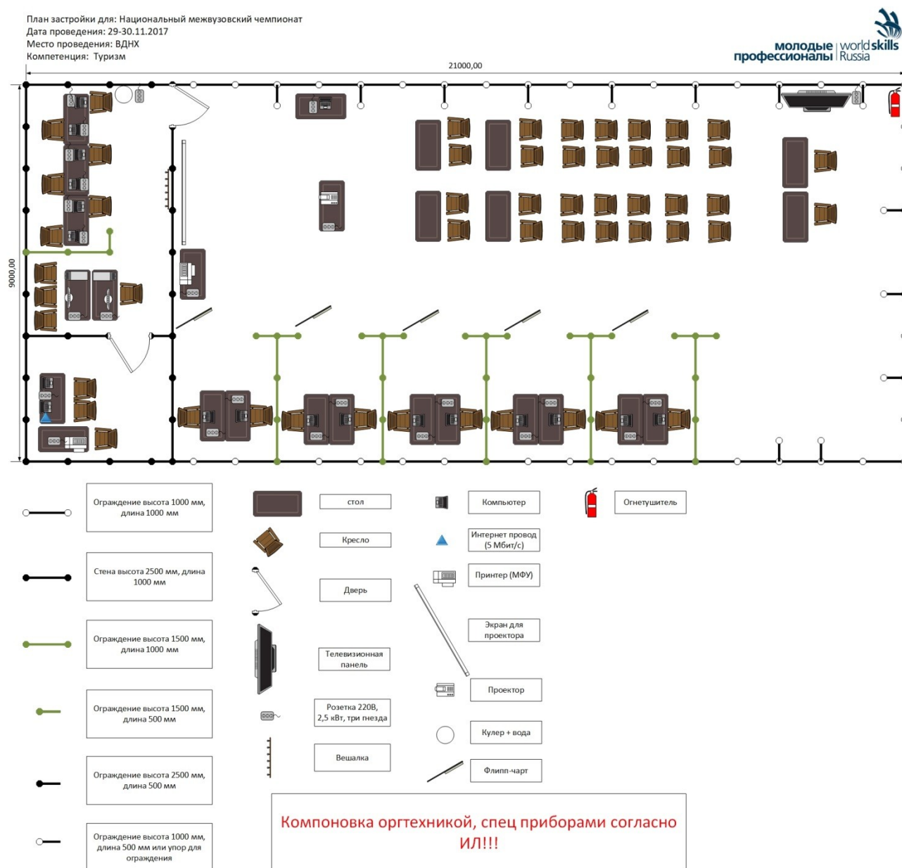
Схема конкурсной площадки